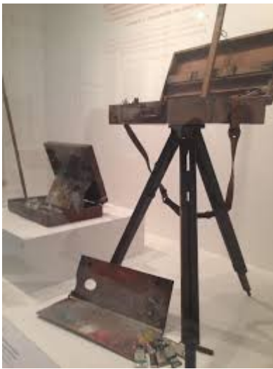
Equip de Van Gogh per pintar a l'aire lliure.

Alguns pintors com Van Gogh (pintor postimpressionista) els agradava pintar a l'aire lliure. Per això van adaptar les coses que necessitaven per pintar per poder-les desplaçar: cavallets amb rodes, maletetes amb les pintures, para-sols, etc. Els pintors anomenats impressionistes són els que ho van practicar més encara que no ho van inventar. Fins a finals del segle XIX els artistes pintaven bàsicament en els seus tallers.