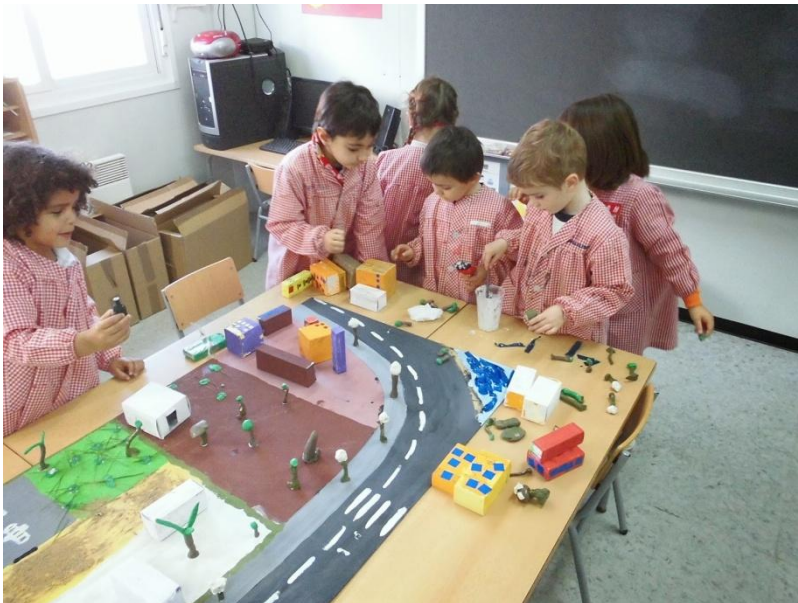
Projecte Transversal de l'Escola l'Arrabassada

http://escolalarrabassada.blogspot.com.es/p/escola-verda.html